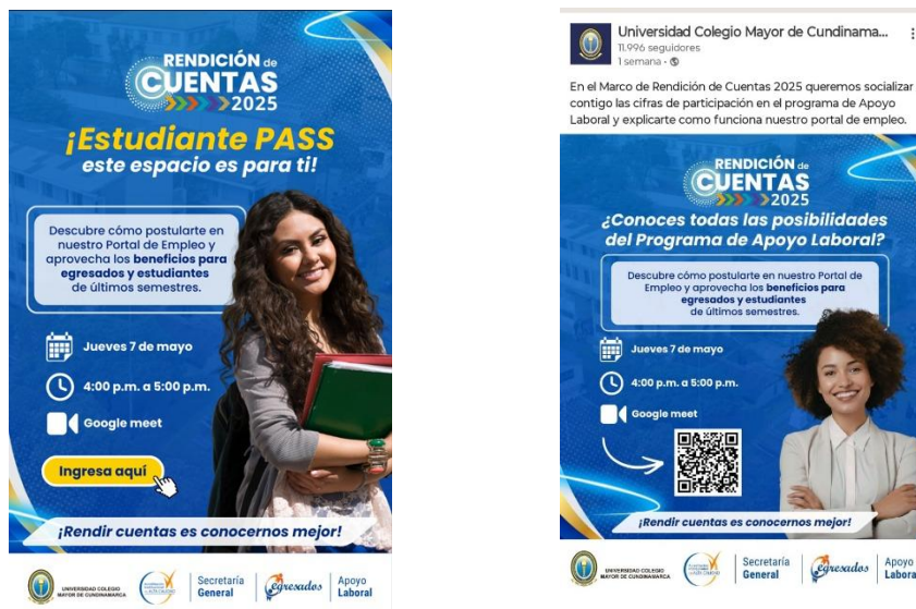
Gráfica 2. Publicación Rendición de Cuentas 2025.